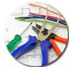
饮水机安装接线示意图